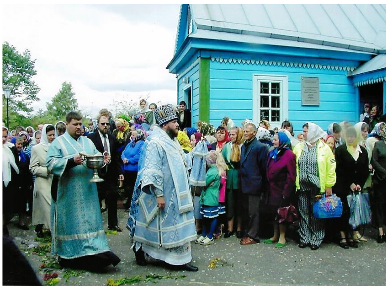
Хрэсны ход у Свята – Дзімітрыеўскай царкве.

Хочацца верыць, што знойдзеныя на папалішчы рэліквіі ўсё ж вернуцца ў храм, а гісторыя яго адраджэння будзе перадавацца ў Лелікаве з пакалення ў пакаленне.