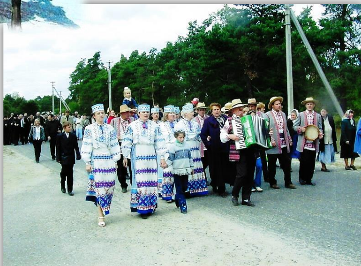
Шэсце жыхароў вёскі, музыкантаў і гасцей па цэнтральнай вуліцы.