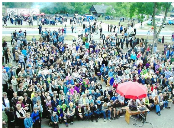
У час свята вёскі Лелікава на плошчы каля Дома культуры.