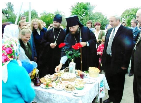
Дзгуставыя кулінарнага майстэрства.